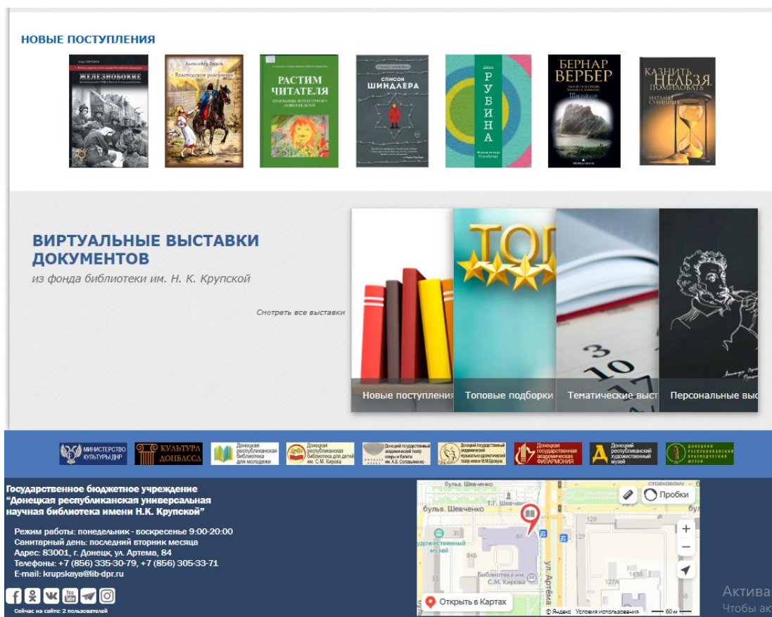
Рисунок 1. Главная страница веб-сайта библиотеки

С помощью сервиса «Виртуальная справка» пользователь по запросу может получить списки документов по интересующей теме, любые фактографические сведения, консультации по библиографическому описанию, использованию библиотечных фондов и другие материалы.